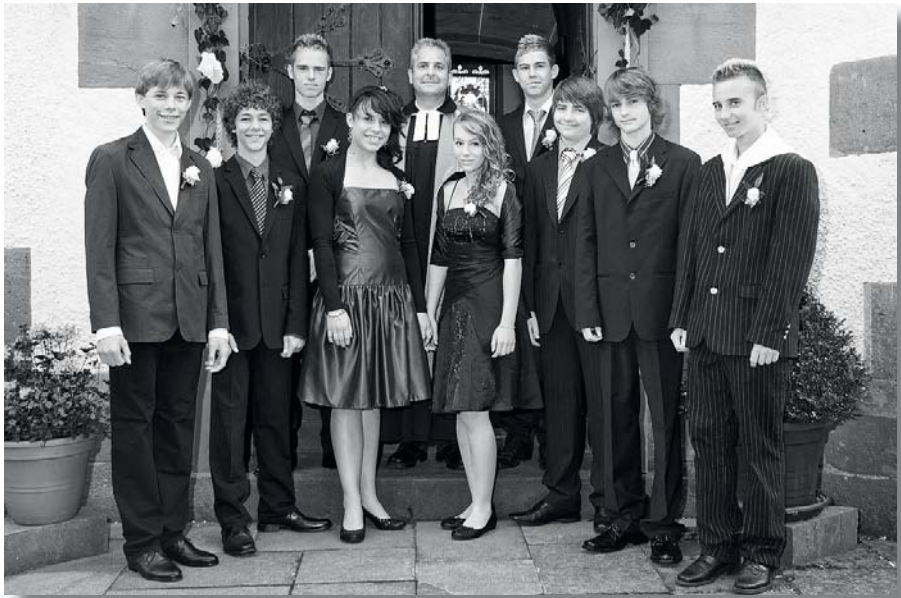
Konfirmanden aus Schwarzenberg (05.06.2011)